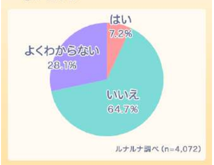
Q.現在のあなたの、女性特有のがんに対する知識は十分足りていると思いますか

しかし、国立がん研究センターと国立成育医療研究センターの集計*2によると、15歳から39歳までのAYA (Adolescent and Young Adult) 世代では女性のがん患者が非常に多く、特に20歳以降は約8割の患者が女性であることがわかっており、若いうちから女性特有のがんについて正しく理解することはとても大切です。